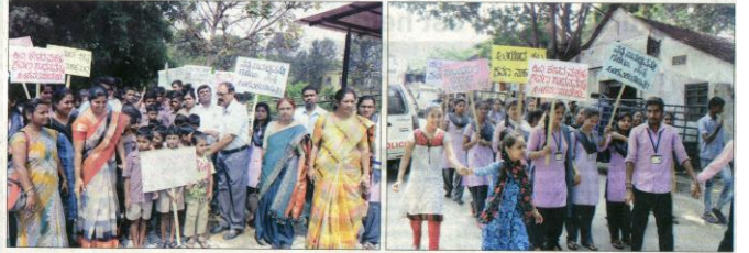
(Continued from page 1)

AIISH Mysuru, a premier institute for communication disorder under the Ministry of Health and Family Welfare, Government of India, has taken the lead role in celebrating the World Hearing Day in India.